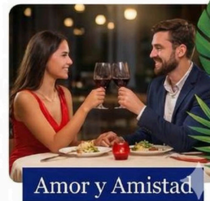
Amor y Amistad