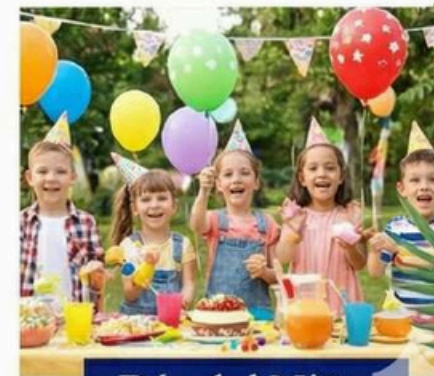
Día del Niño