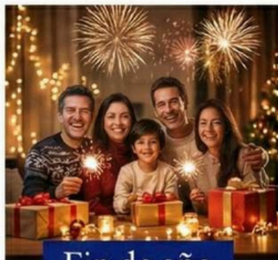
Fin de año

Corporativo-s celebra momentos especiales con sus asociados ofreciendo obsequios únicos para el Día del Niño, fin de año y cumpleaños, fortaleciendo el vínculo con nuestra comunidad.