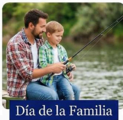
Día de la Familia

Corporativo-s celebra momentos especiales con sus asociados ofreciendo actividades únicas para el Día de la Familia, Halloween y Amor y Amistad, fortaleciendo el vínculo con nuestra comunidad.